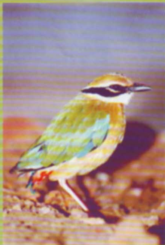
भारतीय पीता (Indian Pitta)